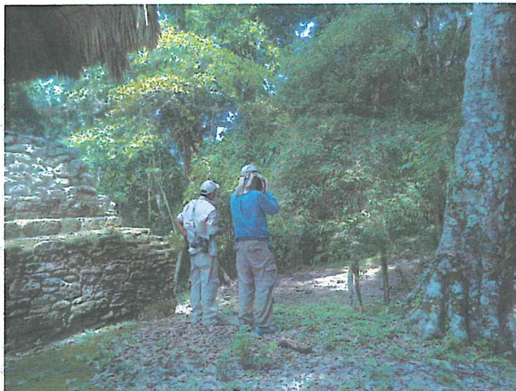
Fig.6: Se está dando acompañamiento y apoyo a la fundación Flaar en la realización de las actividades que realizan dentro del Parque.

La Fundación FLAAR realiza recorridos en distintas áreas con el fin de documentar de manera fotográfica la riqueza cultural y natural del Parque, con el fin de darlo a conocer a potenciales visitantes y generar información para el área protegida.