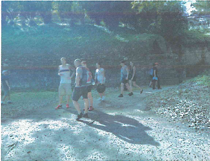
Fig.5: Actividades en zona de uso público sitio arqueológico Yaxha

Se ha recorrido la zona de uso público con el fin de observar las actividades de visita y el trabajo del grupo de vigilancia.